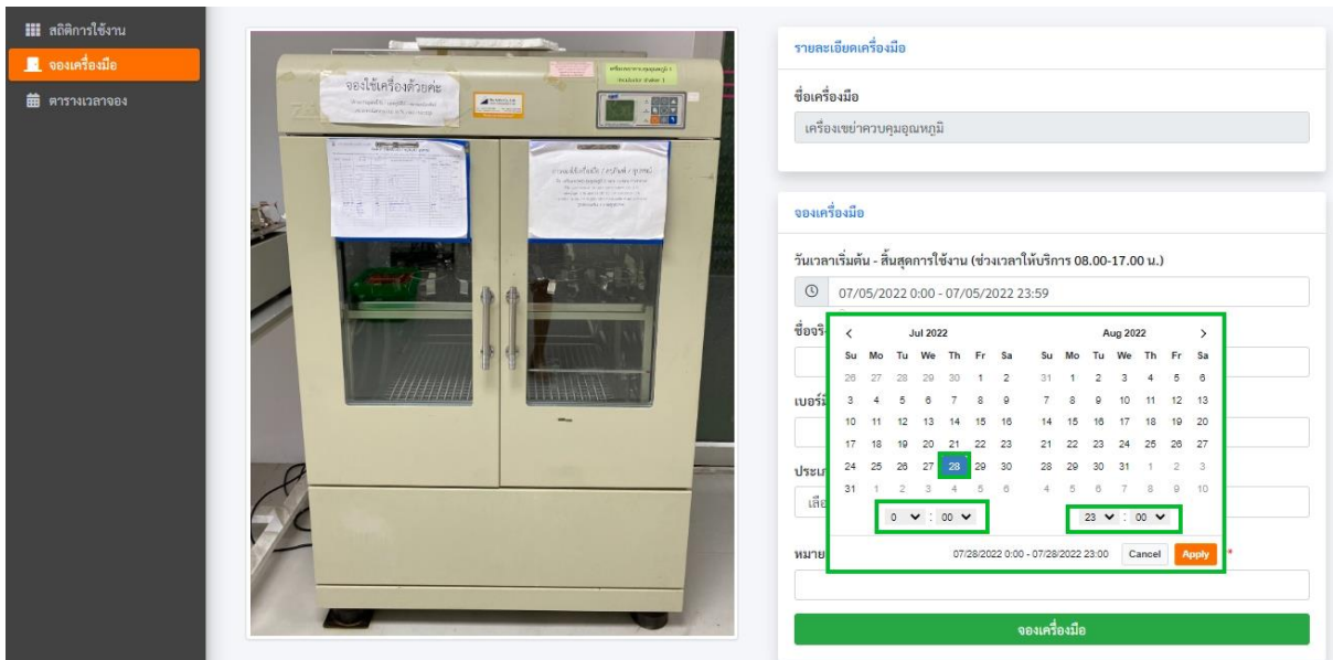
รูปภาพที่ 2.1