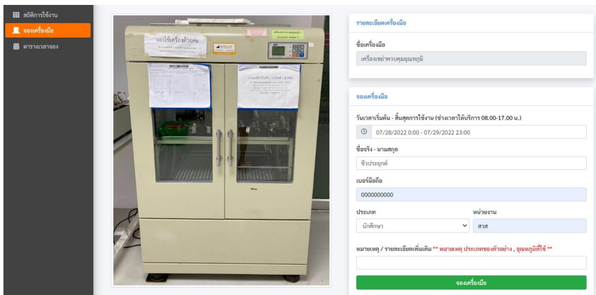
รูปภาพที่ 2