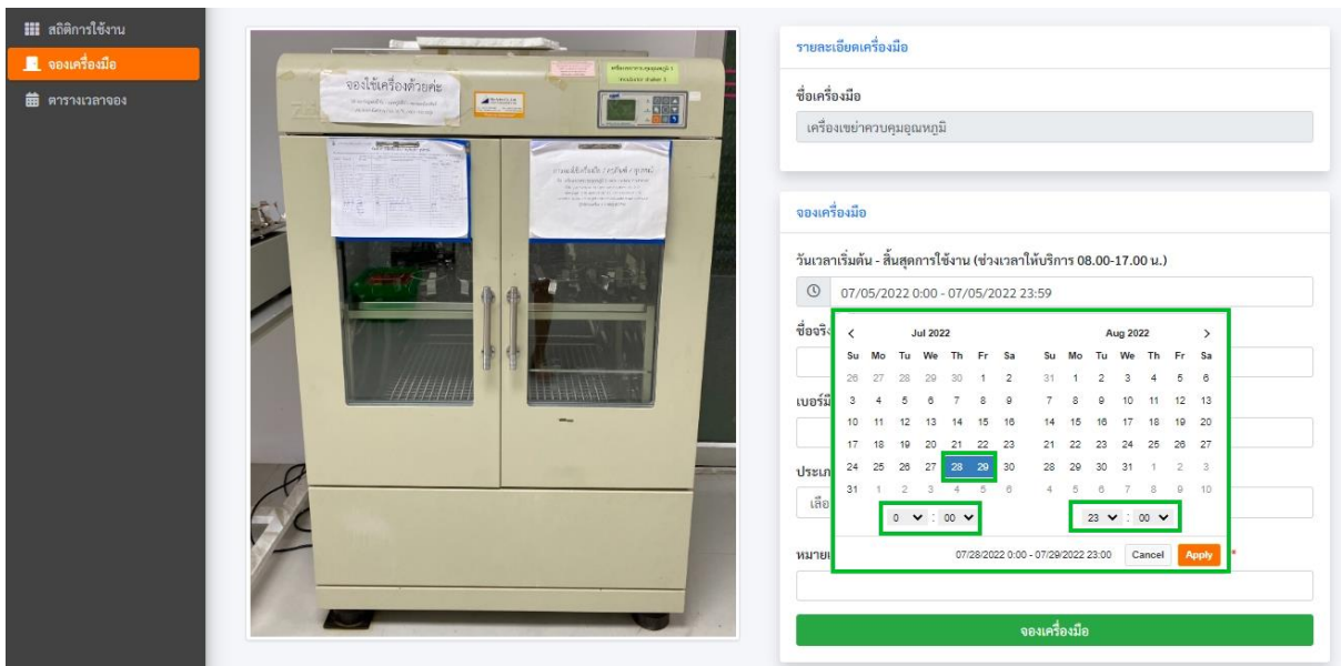
รูปภาพที่ 2.2

** หมายเหตุ ไม่สามารถจองซ้ำวันเวลาที่มีการใช้งานแล้วได้ ต้องทำการจองใหม่